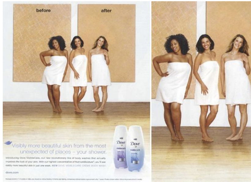
Imagem: Propaganda Dove antes e depois

Outro lugar comum racista, também facilmente percebido pelas publicidades é o branqueamento da pessoa negra que ascende social e financeiramente. Ou seja, quando a pessoa negra é vista em campanhas publicitárias, há um embranquecimento para que seja aceita. Mais uma vez, reforçando a ideia da publicidade a serviço da manutenção da ordem social (branca) vigente.