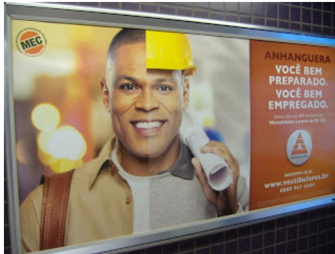
Imagem: Propaganda de faculdade